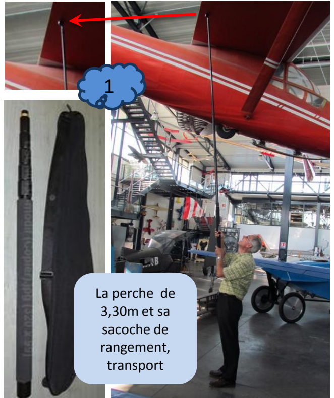
La perche de 3,30m et sa sacoche de rangement, transport