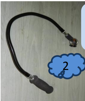
Le bras flexible. Pour les accès difficiles