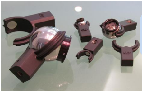
Les Pincés SMR : 1,5"-7/8"-0,5"