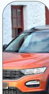
Véhicules & Transports

Nous négocions régulièrement les meilleures conditions tarifaires auprès de plus de 100 fournisseurs