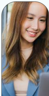
Finance & Ressources Humaines