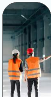
Achats industriels & spécifiques

60 catégories d'achats dans 6 domaines d'intervention