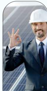
Maintenance & Entretien des locaux